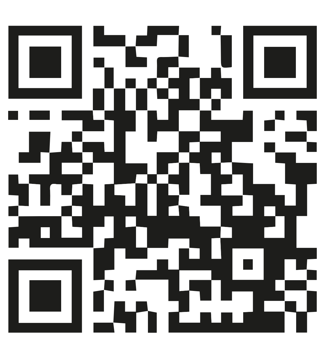
«Аллея соловецких юнг в Самаре: Мальчики с бантиками» (Док. фильм 2020 г. ТРК «Губерния»)