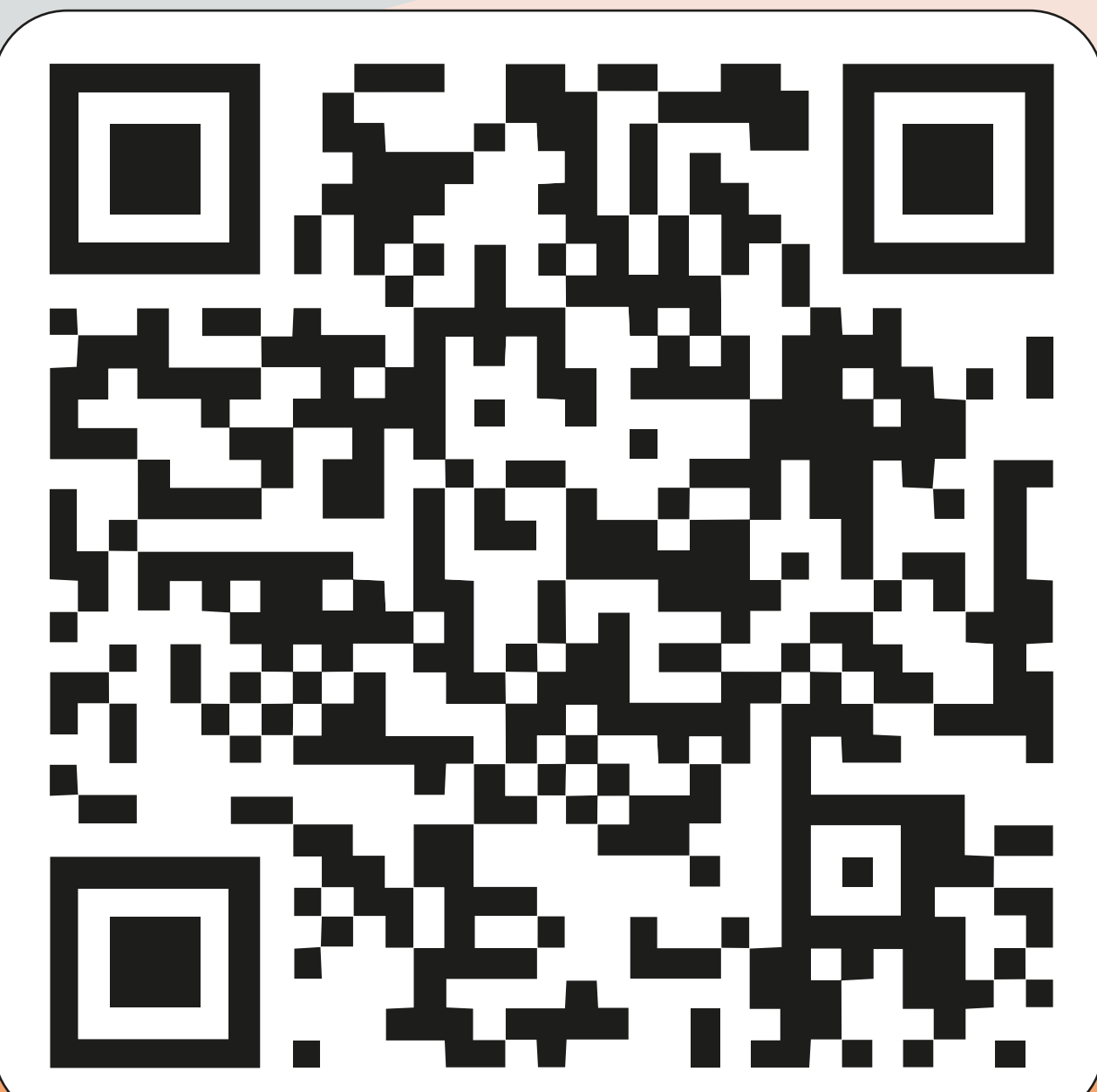
«Юнги Военно-Морского Флота» (Хроника 1943 г. Реж.: Ф. Овсянников)